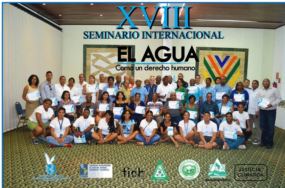
Foto oficial del XVIII Seminario Internacional 10-17 de diciembre de 2015