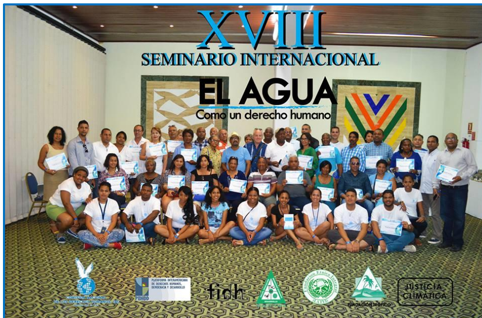
Foto oficial del XVIII Seminario Internacional