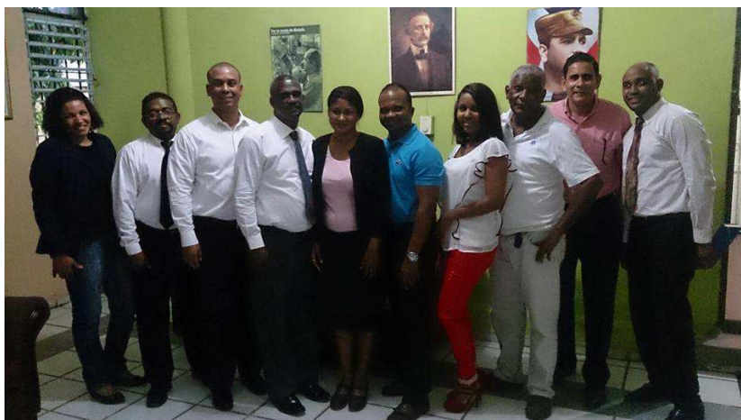
Equipo legal CNDH

Recordamos por esta vía el número de la cuenta de la Comisión Nacional de los Derechos Humanos que es la n. 031-074956-5 en el Banreservas. ¡Con un pequeño aporte de todos trabajaremos más y con mayor efectividad!